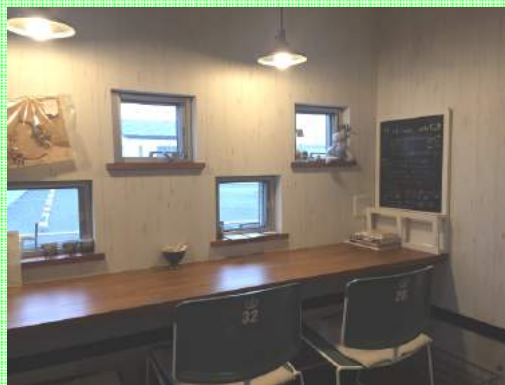
小さな窓から駅が見えます

またまた、茨城県になってしまいますが...南中郷の駅前って行ったことありますか？ここ駅？って思うくらい小さな駅。旧6号線を走っていて南中郷駅への矢印見つけ右折し進んで信号を左に入り狭い道を右に曲がるのですがその過度に矢印もなく曲がり損ねてしまうくらいの道を行ってある駅です。なぜかそんな人も中々降りないだろうと思われる駅の前にカフェがあります。その名も『エキマエカフェ』さんです。2階建てのお店。扉がブルーのかわいい建物。はじめて来た時は道挟んで反対の平屋の小さなレトロな建物でしたが去年の初めに新しい建物に引越しました。お一人様でもくつろげる壁に向かってのカウンター席。オーナーとおしゃべりできるキッチンと向かいのカウンター席もあります。奥には大きなテーブル。二階もあります。二階はワークショップやイベントなどに使える貸し出しスペースになっています。階段したには地元の方の手作り雑貨やお洋服も並んでいます。食べ物もアジアご飯とか懐かしいナポリタンとか...ボリュームミーなサンドイッチとかオーナーが楽しんで作ってるだろうデザートやら美味しいです。オーナーも店員さんもゆったりとしていて和めます。近くにないことが残念。色々なイベントもやっているようですよ。探していってくださいます。