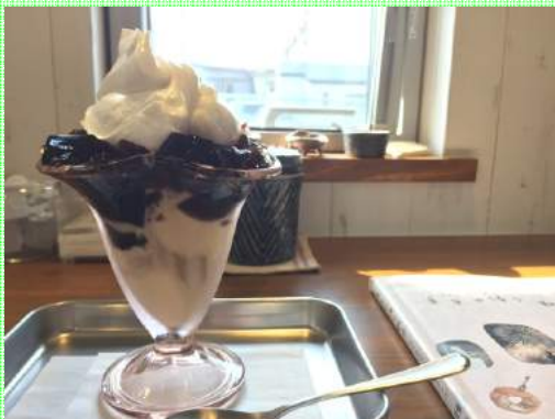
珈琲ゼリーパフェ