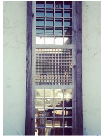
回廊ギャラリー門の窓

益子の帰りには笠間に寄りました。笠間は初めてです。笠間芸術の森公園あたりをぶらぶらしました。回廊ギャラリー 門さんとスペースニコさんに寄りました。ニコさんでは旦那様速攻お気に入りマグカップ購入。小さなギャラリーですがお姉さんも気さくな方で素敵なギャラリーでした。回廊ギャラリーは建物も素敵な大きなギャラリーで陶器もたくさん並んでいます。ゆっくりじっくり観てるうちに何買っていたか分からなくなりました。それからアルパカのお店にも寄ってみました。カラフルな手編みのセーターが並んでいます。色も綺麗だし欲しいな~と思ったど...チクチクするのが苦手なのでやめときました。直売上で朝つみイチゴとレタス買いました。安いイチゴもレタスも水水しくて美味しかった~。石釜パン屋さんもきになりました。ガラススタジオもあるみたいですが...時間も遅くなり旦那様も飽きてきたようなので又今度のお楽しみにして帰ってきました。陶器好きな主人のおかげで中々楽しい日になりました。