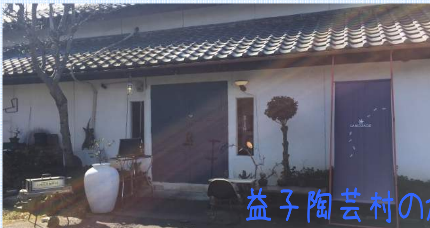
益子陶芸村のカフェ