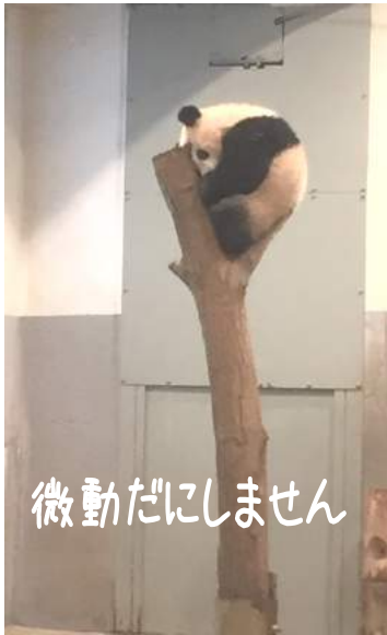
微動だにしません

夕方寒くなってきてシャンシャン観覧時間少し前に戻り並びました。パンダの観覧には4つのエリアで区切られていて、30秒ずつ観覧します。短い時間ですが結構自由に見れます。ママパンダは大きくってかなり活発にウロウロと動いてました。パパはいませんでした。シャンシャンは最終観覧時間とあって・・・お疲れのようでお昼寝タイム。木の上で挟まるようにしてまん丸になって寝てました。30秒間ぜんぜん動きませんでした。でもピンクで丸まりようがとても可愛かったです。動いてる姿見たかった～。