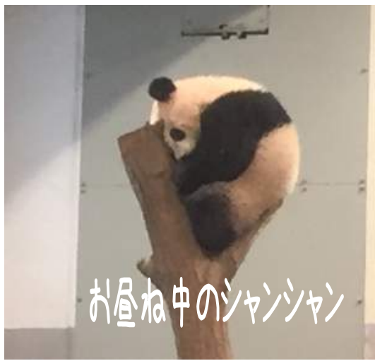
お昼寝中のシャンシャン