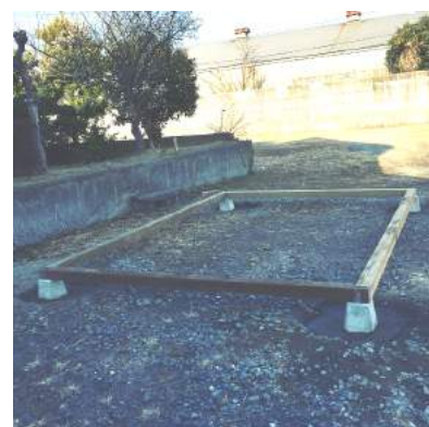
水平が取れました。土台を乗つけて…これが大切です。