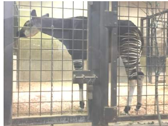
真ん中の柱が邪魔ですがオカピです。