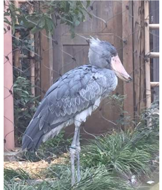
凜々しいお顔のハシビロコウ

当日10時チョイ過ぎに上野到着待ち合わせの公園口へ。妹が先に着いていて娘は姿なし。駅に着いたと連絡が入ったがなかなか姿が見えない。やっぱり…。公園口は難しかったか～。と娘が銀座線から公園口に着くのに時間がかり待っている間、平日だと言うのに上野公園へ入っていく人がたくさん。その上保育園の遠足の子供達もぞくぞくと公園へ入っていくし、整理券もらえるかな～？と心配になりました。やはり上野動物園の表門は行列が出来ていて入場券を買えたのが11時頃。そして中に入りパンダ観覧整理券をもらいます。整理券はすんなりともらえますがその前に入場券買うのに並びました。もらった整理券の時間は15時40分。整理券を持っていれば1度だけ再入園が出来ます。まずは他の動物を見て…。ご飯を食べに外へ出て時間に又戻ろうと言うことになりました。上野動物園は娘がお腹に入るときに息子を連れてきた以来なので25年ぶりでした。近頃はパンダの他には『ハシビロコウ』が人気でぬいぐるみやグッズも多かったです。『オカピ』が思ったより大きくなって間の抜けた顔のシマウマのようなキリンのような馬のような…。のが結構人気でした。これはキリン種族で珍獣だそうです。ぶらっと1週して1度外に出てランチをしてその辺をブラブラしました。